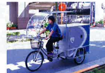
SGホールディングスグループは、高知県などで管理する「さがわの森」でJ-VER認証を取得した(右)。トラックの代わりに三輪自転車を活用して集荷・配達時のCO 2 排出量を削減する(上)