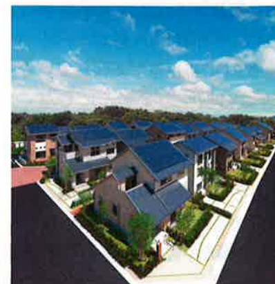
ミサワホームは、国内クレジット制度に基づいて太陽光発電システムなどを設置した住宅が削減したCO 2 排出量をクレジット化している

国内クレジット関連事業を支援する日本テビア(東京都港区)の富川健太副社長は、「世界的に見ても規制なしにクレジットの取引が活発になっているところはない。産業界に規制をかけるか、制度の認知度を上げて市民権を得るかどちらかが必要